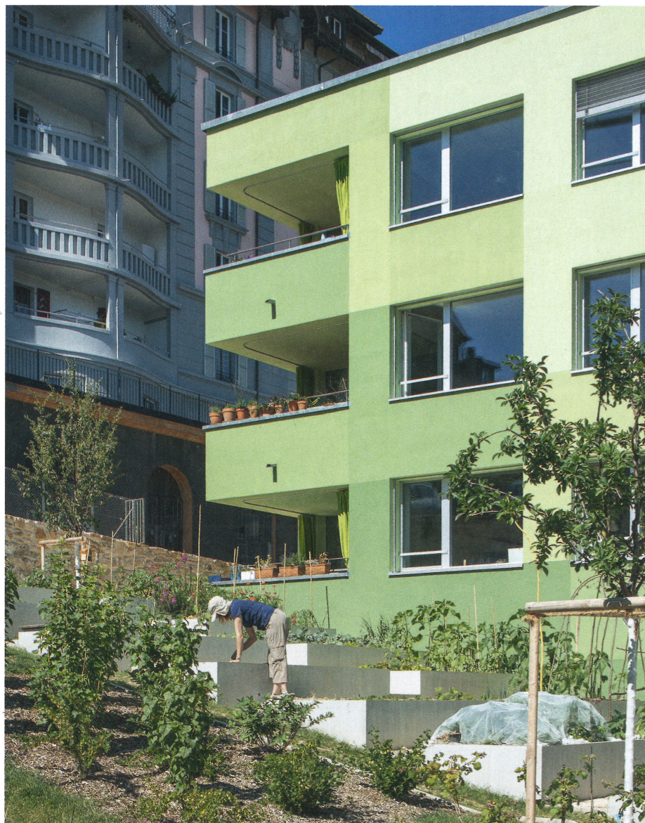
C Potagers urbains dans les anciennes couches horticoles

tif, afin d'inclure dans la réflexion l'ensemble des acteurs concernés par le développement du quartier.