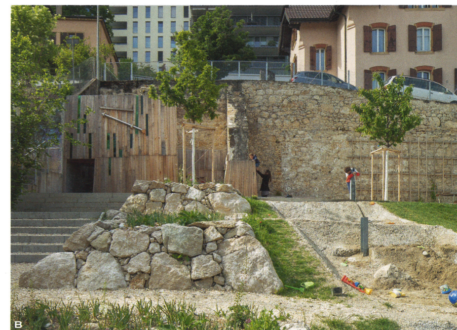
A Parc de Vieux-Châtel à Neuchâtel, vue générale depuis l'ouest B Place de jeux et aménagements «biodiversité»